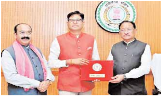
रायपुर (अग्रदूत) । मुख्यमंत्री विष्णु देव साय से आज विधानसभा परिसर स्थित उनके कक्ष में वित्त मंत्री